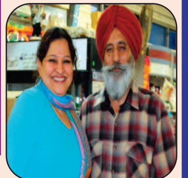
Baksho Kaur Bisla Hardev Singh Bisla

Toilet Water Pressure (Elite 2 Bio Bider) A budget Friendly solution for your desire to feel exceptionally clean and reduce toilet paper waste Only $ 39.99+Tax